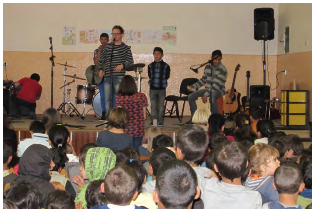
Concert de cloture à Stará Lubovňa